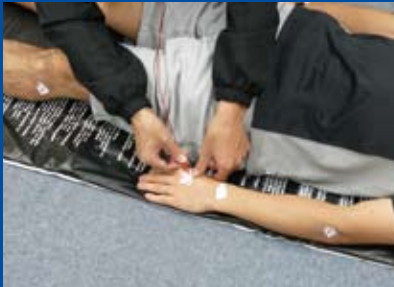
電極貼付位置は左右腕と脚12カ所。まず電極シールを貼り、電極クリップを挟み込む。