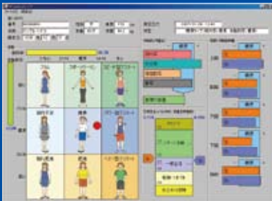
測定値と標準値の比較、日常生活レベル、筋肉率と体脂肪率から求められる体型マトリックスによる体型タイプが表示される。